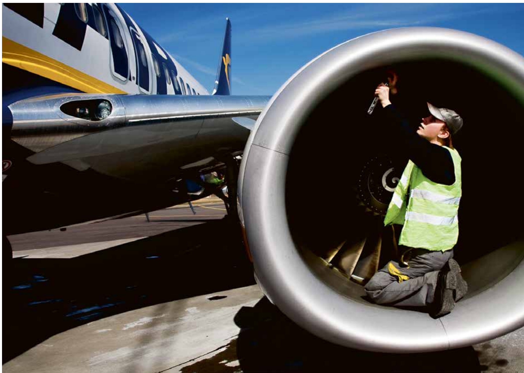
I Nyköping finns en uppskattad gymnasieutbildning för flygmekaniker.