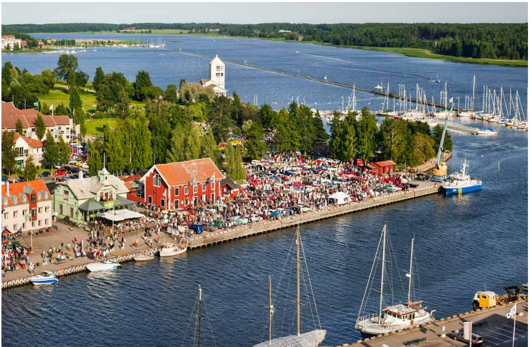
I Nyköping är det nära till skärgården. Sommartid går turbåtar från hamnen.