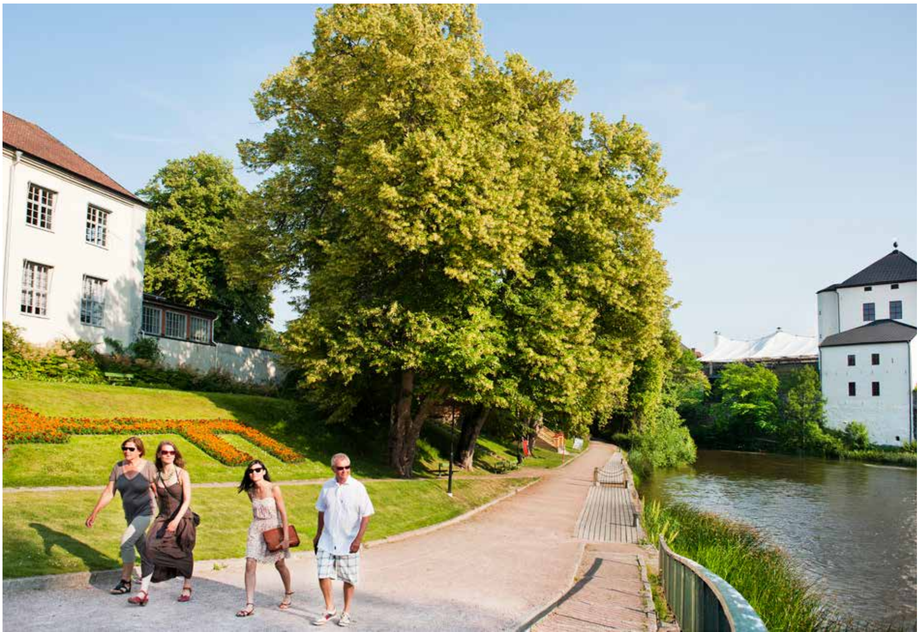
Utmed Nyköpingsån möter du kultur, historia och trevliga matställen.