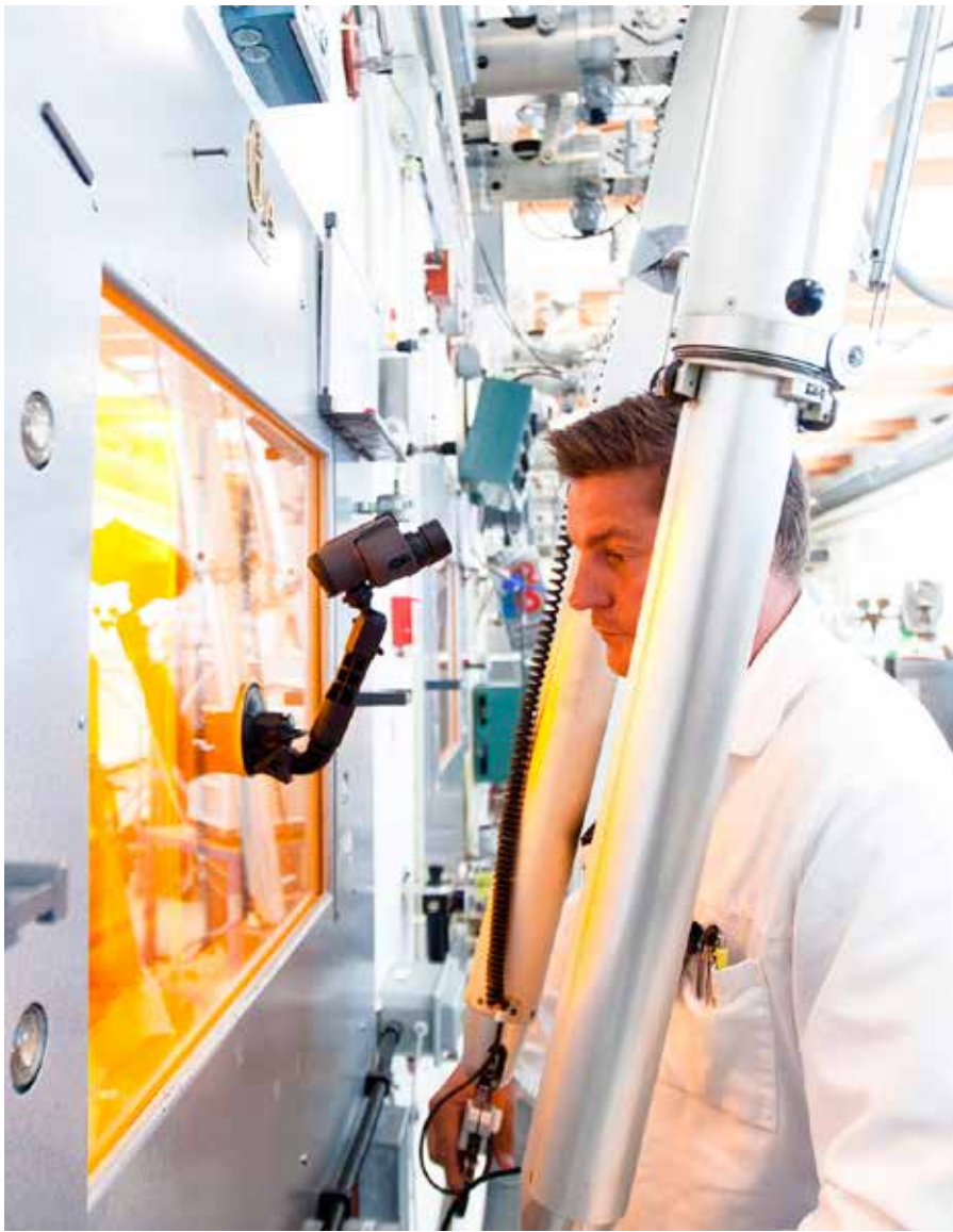
Nyköping växer både som bostadsort och plats för företaget.