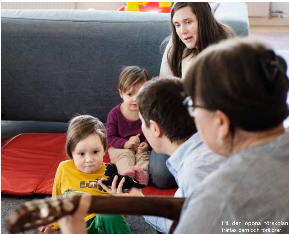
På den öppna förskolan träffas barn och föräldrar.

För mer information besök www.nykoping.se eller ring oss. Arnö familjecentral, tfn 24 87 24, Brandkärr familjecentral, tfn 24 84 96.