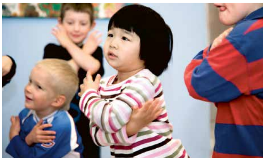
Antalet förskoleplatser ökar när Nyköping växer.