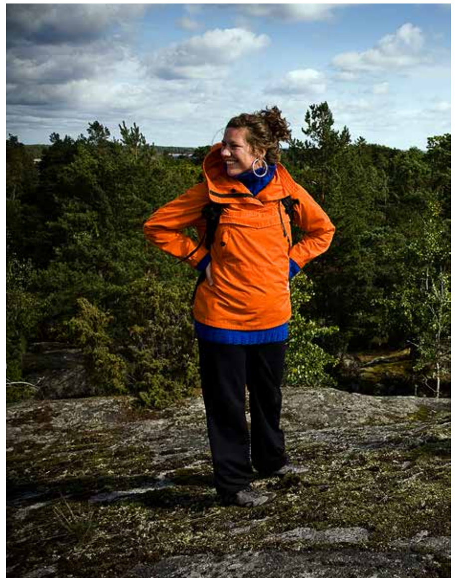
Sörmlandsleden tar dig utmed ostkusten.