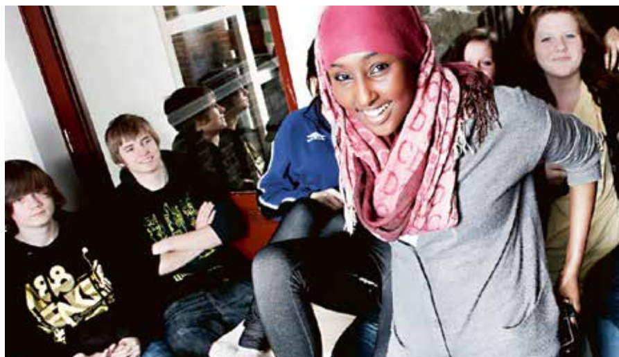
Under 2014 invigdes Nyköpings nya högstadium.