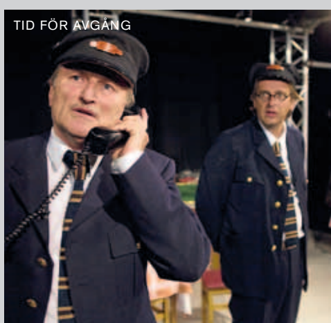
TID FÖR AVGÅNG