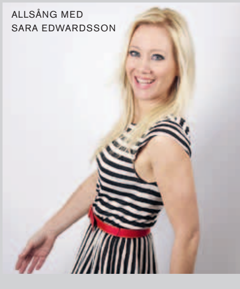
ALLSÅNG MED SARA EDWARDSSON