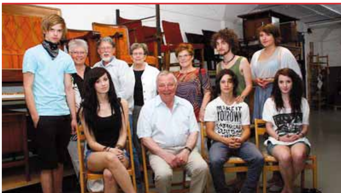
Ungdomsbloggen och seniorbloggen. Varje dag kan man läsa deras tankar och associationer utifrån saker de själva har valt och fotograferat i museets stora samlingar.