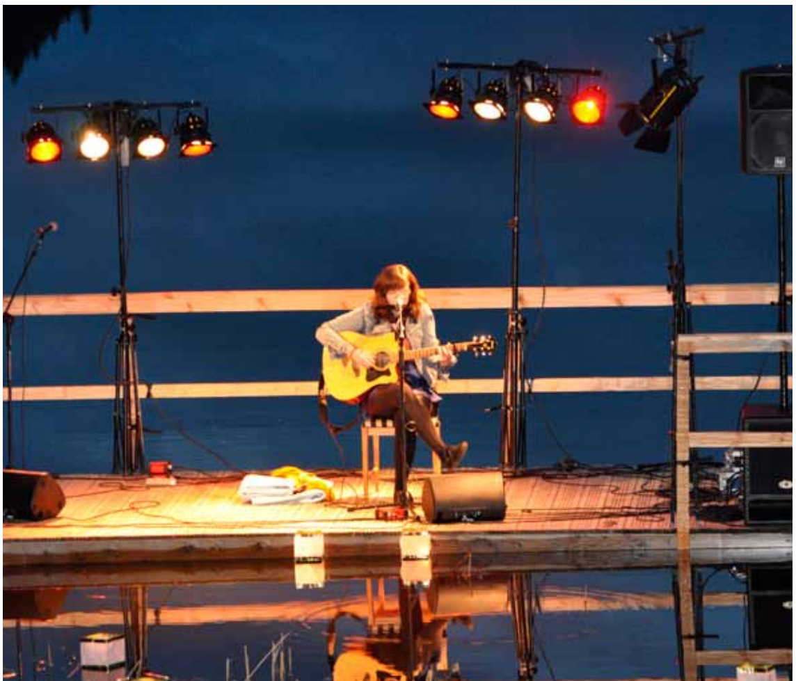
Nynäsfesten 2010. Runtom i den stora slottsparken erbjöds förutom artismöten och konserter, där vissa fick ta roddbåt till scenen, en mängd aktiviteter som smootheicykling, slöjdvverkstad, streetdancetält, slottsvandringar, grillning och mycket annat.