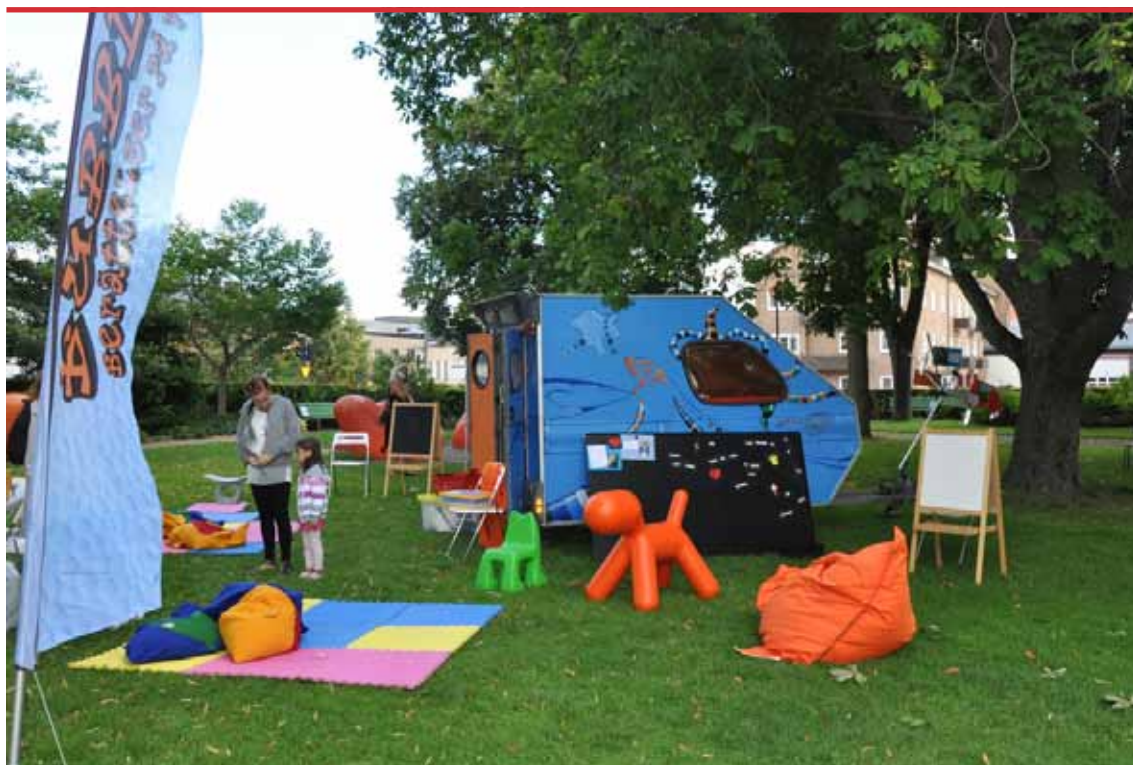
Bubblan – husvagnen med berättelser på väg – förbereder sig för anstormningen av 300 barn i Stadsparken under Katrineholmsveckan 2011.

Människor vänder sig till de bibliotek de har i sin närhet, och som fyller deras behov, utan att tänka på att biblioteken har olika huvudmän och olika uppdrag – det blir BIBLIOTEKET som funktion i ett samhälle i utveckling. ”Har man kommit till ett bibliotek har man kommit rätt.” Genom att utveckla nya arenor, exempelvis genom projektet ”Bubblan”, når biblioteken fler nya grupper.