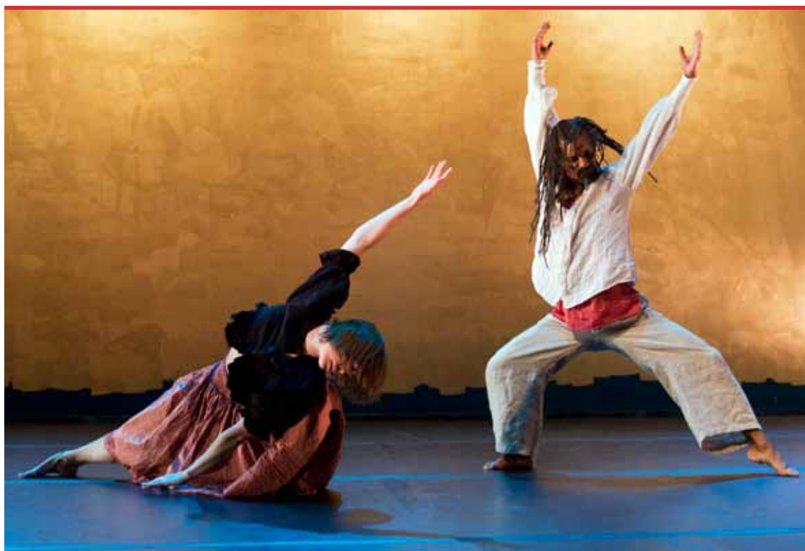
Dansgruppen "Vindhäxor" på den tredje och senaste dansfestivalen i Nyköping. Ett samarbete med Nyköpings kommun och Nyköpings Teaterförening. Festivalen innehåller föreställningar för alla åldrar, dessutom dansworkshops och föreläsningar.

Sommarmusikserien Musik på Sörmländska Slott och Herresäten produceras av Scenkonst Sörmland och ett stort antal både offentliga och privata arrangörer är involverade. Unika spelplatser i det intima formatet skapar arbetstillfällen för frilansartister, hittills med tyngdpunkt