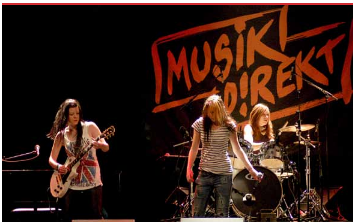
Musik Direkt 2010, bandet New Foundation i länsfinal.

I bilaga redovisas den ekonomiska fördelningen av medel till de olika verksamhetsområdena, båda avseende statlig, regional, kommunal eller