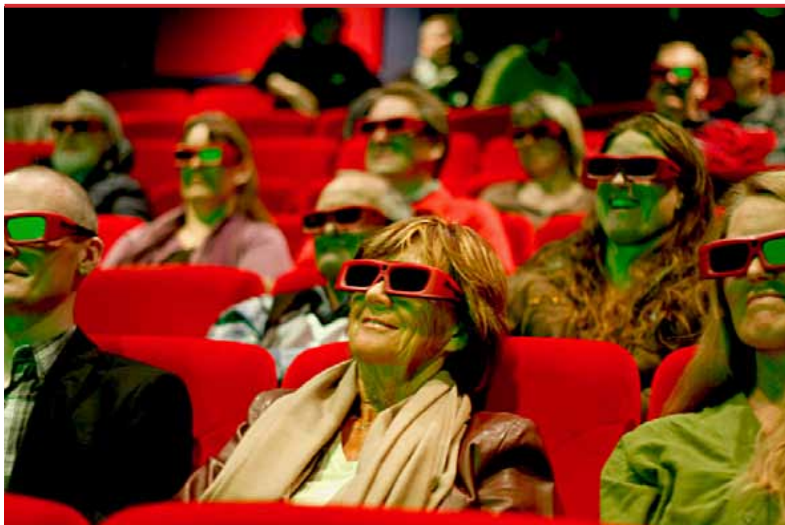
Länsutbildning i visningsområdet. Deltagarna får prova 3D-visning. Den 19 oktober 2010 på Riobiografen i Eskilstuna.

Länsbildningsförbundet och länets studieförbund är viktiga samarbetspartner för att kunna utveckla filmskapande på den kommunala nivån. Film i Sörmland vill fortbilda fritidspedagoger samt cirkelledare inom studieförbunden i eget filmskapande för att utveckla möjligheter till eget filmskapande på fritiden för både barn, unga och vuxna.