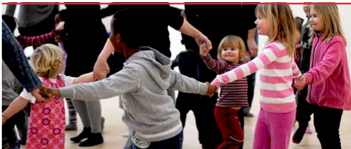
Dans för barn och vuxna tillsammans på Kulturhuset Ängeln i Katrineholm. En öppet hus-verksamhet som erbjuds bland annat Sörmlands kommuners bibliotek någon gång per termin

I Oxelösund pekar man på kulturens betydelse för kommunens utveckling och folkhälsan, och har såväl barn och unga som äldre som prioriterade områden. Här arbetar man med sitt bibliotek Koordinaten som kulturell mötesplats, också med konst och skapande verksamhet i fokus. Visionen i Nyköping pekar bl a på mål som tillgänglighet, valmöjlighet, professionellt bemötande, hållbar utveckling och mångfald/integration i kulturutbudet. Även här har barn och ungdomar särskild prioritet, och aktiviteterna ska ge rika upplevelser, kreativitet och gemenskap, som stimulerar deras utveckling. I Nyköping vill man också erbjuda fungerande mötesplatser för kulturlivet, där invånarna delar kunskaper och intressen med varandra. Eskilstuna är mitt i ett omfattande arbete med ett kulturprogram och betonar vikten av den breda dialogen med föreningsliv och kulturaktörer, politiker, fokusgrupper kring olika ämnesområden, ungdomar, pensionärer mm, i syfte att nå en stabil och levande kulturplan som skapar möjligheter till ett gott kulturliv i staden.