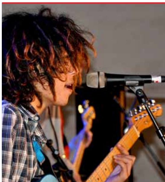
Från Nynäsfesten 2010. Super Hot Giant Alien spelar i Fähuset.

Tillsammans med kommunala kulturskolor utgör studieförbunden en hörnpelare i svenskt musikliv. Tusentals cirklar för unga musiker svarar för en tillväxt i det som brukar kallas det svenska musikundret. Förutom fostran och möjlighet till musikalisk utveckling får många unga möjlighet till scenvana, musiktävlingar, hjälp att skriva sin egen musik och spela in sin egen skiva. Många unga dansare tar också sina första stapplande steg i studieförbundens regi. Studieförbundens verksamhet inom de praktiskt - estetiska områdena täcker in alla kulturyttringar, och ger människor möjlighet att praktiskt delta i kulturella aktiviteter. Många studiecirklar har dessutom den uttalade uppgiften att använda äldre hantverkstekniker, som ett led i att ta till vara vårt kulturarv. Studieförbunden erbjuder också allmänheten en mångfald kulturupplevelser i form av olika kulturprogram. Under 2010 genomförde studieförbunden i Sörmland tillsammans 5 455 kulturprogram med 361 190 deltagare!