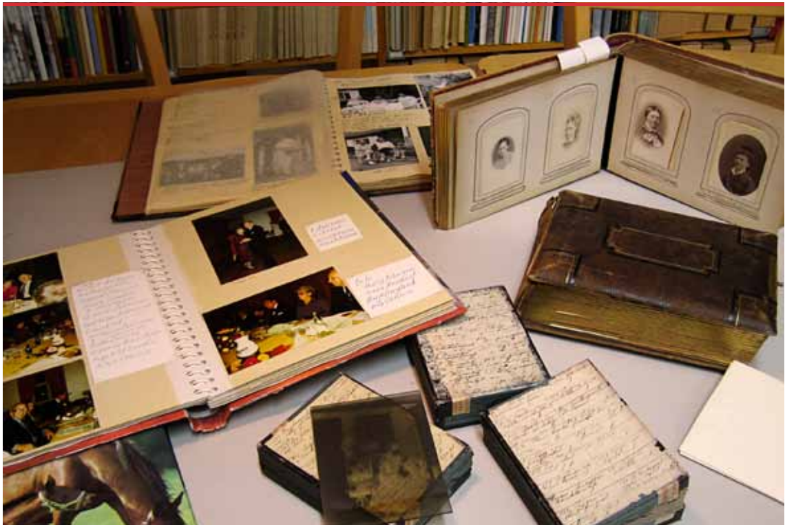
I museets välordnade arkiv och bibliotek finns handlingar, böcker, kartor, brev och en stor mängd fotografier. En guldgruva för nyfikna.

Även den fysiska tillgången till arkiven och arkivmaterialet är väsentlig. Genom det nyöppnade arkivhuset i Eskilstuna Eskilskällan där även Föreningsarkivet i Sörmland och Företagens arkiv finns och bemannar disken har tillgången till materialet underlättats avsevärt. För Sörmlands museums del kommer det nya huset i Nyköping, där även Nyköpings Förenings- och företagsarkiv kommer att finnas, att ge liknande möjligheter.