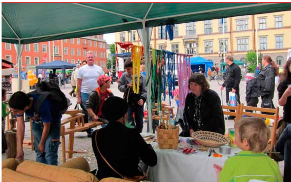
Slöjdhappening inom ramen för Sörmlands museums och Hemslöjdsföreningen Sörmlands projekt Do It Yourself hantverksaktivism vid Springpride, våren 2011 i Eskilstuna.

Kring detta vill Sörmland inleda en dialog med både Kulturrådet och länets kommuner.