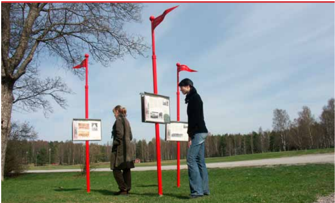
Historien i Sörmland berättar historia på plats, berättar om de stora sammanhangen med de lokala händelserna som exempel. Skyltarna finns på många orter runt om i Sörmland, varje ort har sitt eget tema.