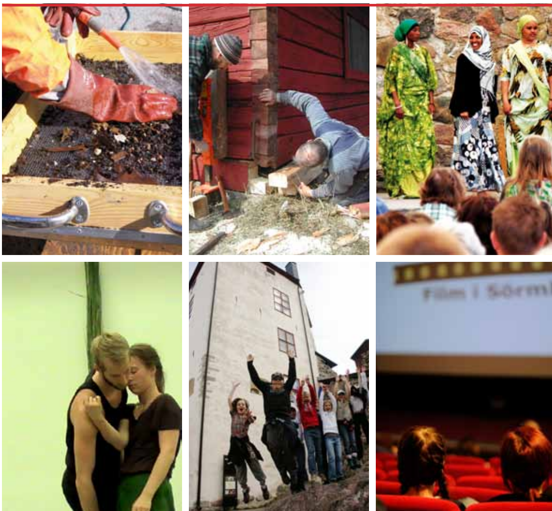
Länet innehåller många varierande kulturuttryck, -möten och -mötesplatser. Kulturmiljövård, musik, dans, museiverksamhet och film är några.

Vissa frågor behöver genomföras i tätt samarbete med Länsstyrelsen som statens representant, i synnerhet frågor om kulturmiljövård, KKN, hållbar utveckling, regionalt utvecklingsarbete m m. Även inom andra områden kan samverkan och samråd bli nödvändiga, inte minst inom mångfaldsarbete och integrationsfrågor. Former för att skapa kontinuitet och struktur för detta behöver därför tas fram under det kommande året.