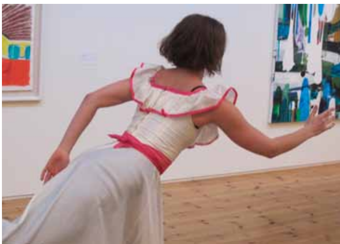
Workshop för barn och vuxna med konstnär Ingela Svensson under Kultur10 i Strängnäs.