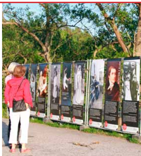
Lukta, känna, lyssna, berätta. Minnesutställningarna väcker minnen och inspirerar till samtal.