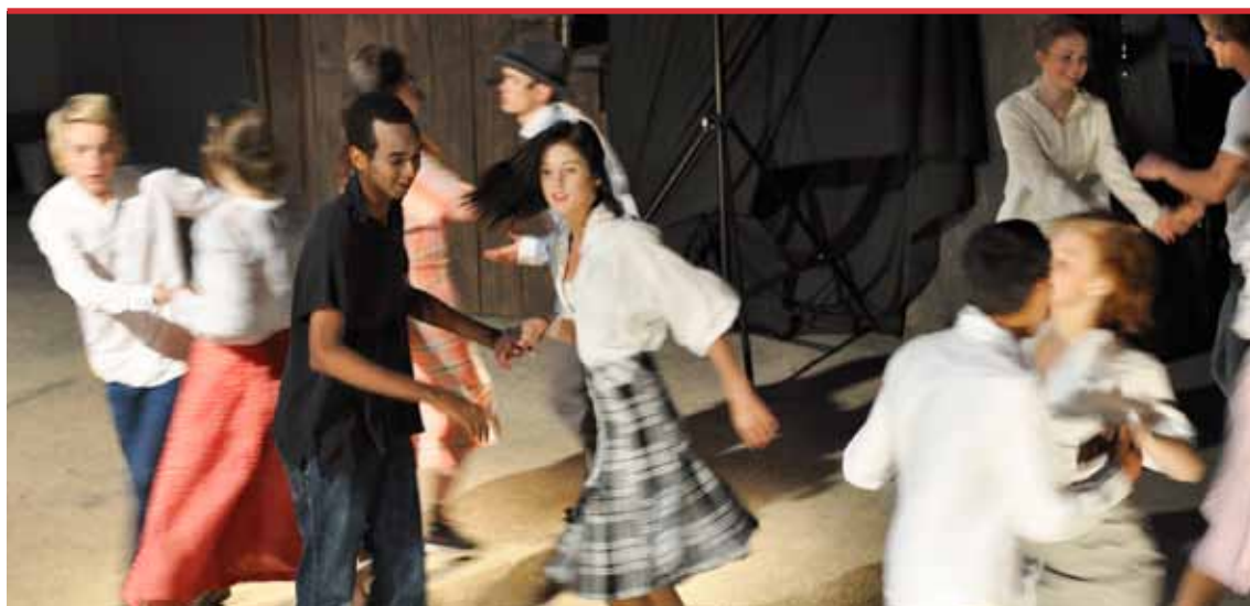
"Järnkoll" på Kolhuset i Hälleforsnäs, ett Skapande skola projekt för och med högstadiel elever från grundskola och särskola.

Samverkan sker interregionalt genom olika dansprojekt i skolor, exempel Dansa + Matte med Västmanlands danskonsulent. Tillsammans med den professionella dansen vill Dans i Sörmland utveckla interregionala och internationella nyskapande projekt där dansens olika aktörer kan mötas, från amatörer till professionella dansare och koreografer. Man vill också fortsätta arbeta för att utveckla internationella och interkulturella nätverkskontakter.