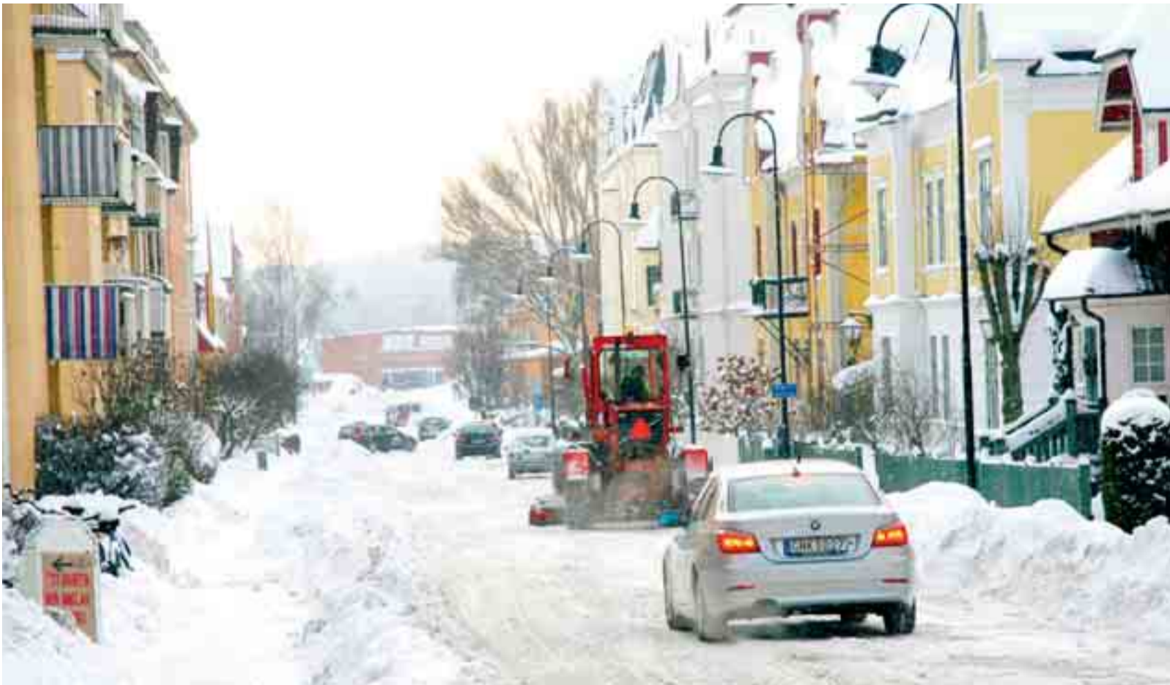
Fruängsgatan i fjol.