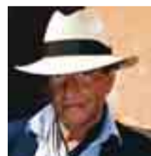
Björn Ranelid kommer till Nyköpings teater 2 februari.

Skapa i lera. Ringla, kavla och skulptera i lera På Barnkulturcentrum kl 11–15. Entré 30 kr/dag.