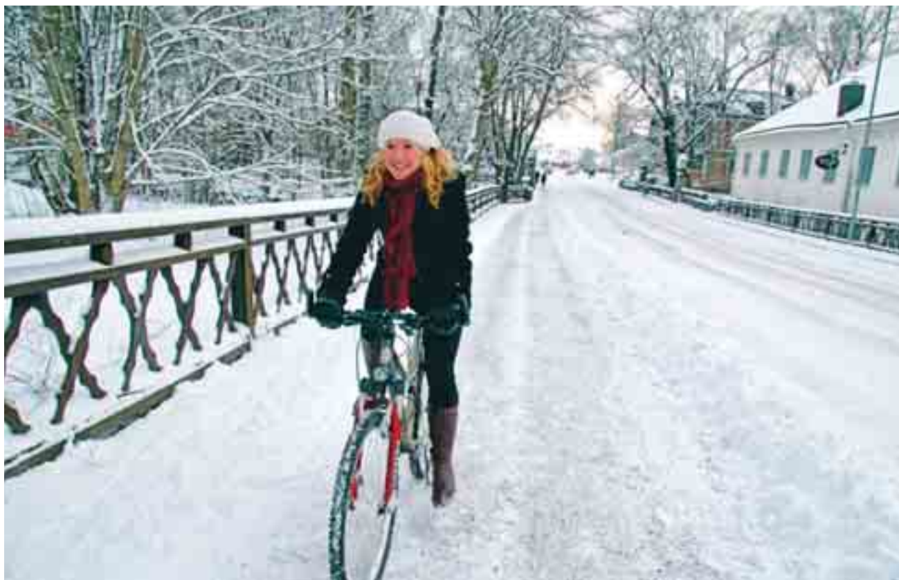
Varje år utökas gång- och cykelvägarna i Nyköpings kommun och allt fler väljer cykeln. Under 2012 bygger kommunen en ny gång- och cykelväg längs hela Folkungavägen.