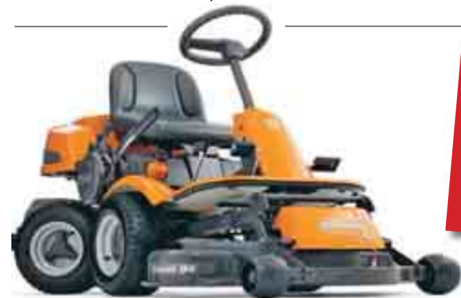
Husqvarna Rider 16 AWD

Ridern har samma avancerade bakvagnsstyrning som övriga modeller, och är även utrustad med steglös variabel hydrostatisk transmission inkl. All-Wheel-Drive. AWD ökar märkbart manövrerbarheten på trånga och hala ytor. Frontmonterat 94 cm brett Combi klippaggregat som ger dig klipp-