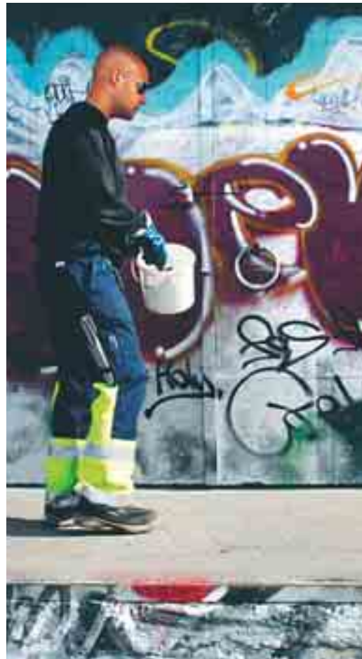
2008 kostade skadegörelsen 3 miljoner kronor.