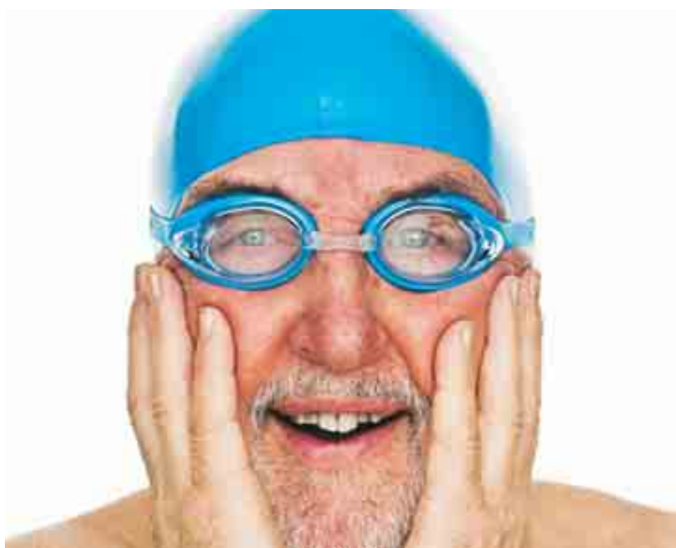
Bildmålning av foto: Johan Eriksson