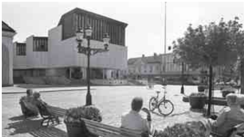
Stora Torget och Stadshuset är den naturliga mötesplatsen i Nyköping.

och Stadshustrappan som en naturlig mötesplats för medborgarna.