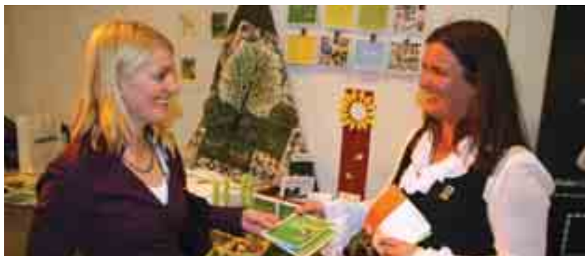
Många kontakter knöts på Näringslivsdagen den 3 november.