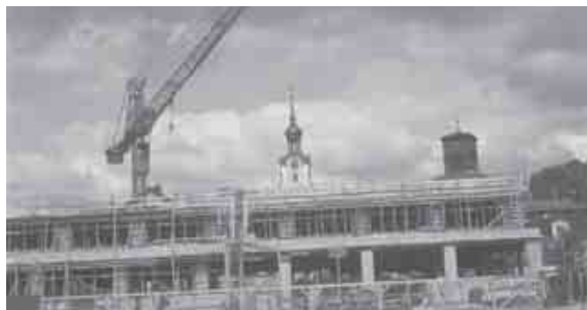
Bygget av Stadshuset pågick under perioden 1966 – 1969. Riksantikvarieämbetets utgrävningar spred nytt ljus över Nyköpings historia.

byggnader. Trots att 16 år gått sedan invigningen hör man fortfarande en och annan mumla om att ”förstöra hela torget”. Men tiden läker alla sår heter det ju. Frågan är bara hur lång tid det ska behövas för att Nyköpingsborna i gemen ska börja tycka om sitt Stadshus. Kanske krävs det att en ny generation har trätt till. En generation som inte har den gamla stadsbilden på näthinna.”