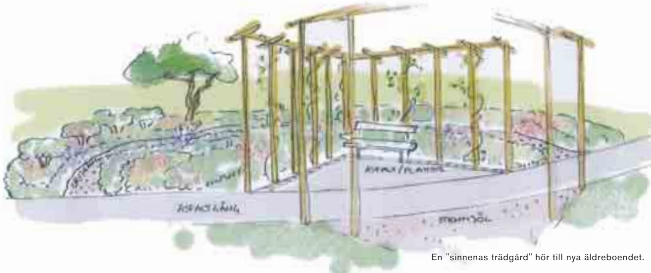
En "sinnenas trädgård" hör till nya äldreboendet.

Granne med en förskola och eget kök med två rätter att välja mellan varje dag. Det kan de som flyttar in i Brandholmens äldreboende se fram emot. I april öppnar det.