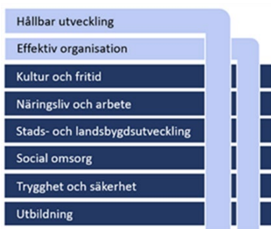
Bild: Nyköpings kommuns målområden i budgeten

leverera och utveckla kvalitativa välfärdstjänster och involvera medborgarna löpande i beslutsfattandet är grundläggande för en god lokal demokrati.