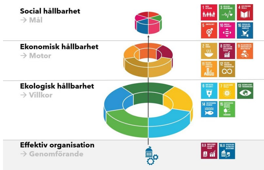
Bild: Nyköpings hållbarhetsarbete kan åskådliggöras genom den så kallade "måltårten". Den visar dels hur de globala målen fördelas mellan dimensionerna och vilken övergripande logisk funktion de har.

Arbetet med att genomföra Landsbygdsstrategin ska bidra till att uppfylla målen i Agenda 2030 vilka beskrivs i hållbarhetsprogram för Nyköpings kommun. Nedan beskrivs programmen översiktligt men för tillämpning och mer information hänvisas till respektive program.