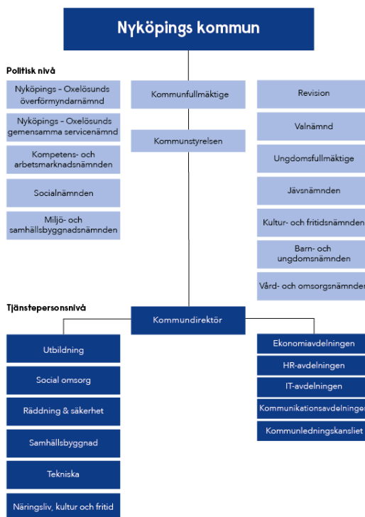
Figur 1.1. Organisationsschema över Nyköpings kommun.

Fullmäktige redogör för kompetens- och arbetsmarknadsnämndens ansvarsområden i nämndens reglemente. 9 Nämnden har ansvar för kommunens uppgifter inom arbetsliv, lärande för vuxna och integration. Detta innebär att kompetens- och arbetsmarknadsnämnden är ansvarig för kommunal vuxenutbildning (Skollagen 2010:800, kap 20), däribland SFI.