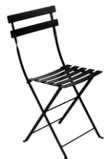
Företag: Fermob Modell: Bistro

Denna sida visar inspirationsbilder på godkända möbel- och stakettyper. Det föreligger inga krav på att använda just dessa produkter, huvudsaken är att möblerna fungerar bra på platsen. Även de miljöbilder som visas i denna skrift fungerar som riktlinjer för hur din uteservering kan utformas.