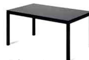
F: Skagerak M: St Thomas