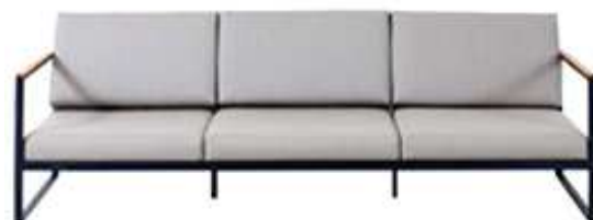
F: Röshults M: Garden easy sofa