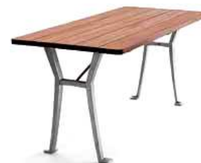
Företag: Byarum Modell: Lessebo