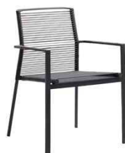
F: Cane-Line M: Edge