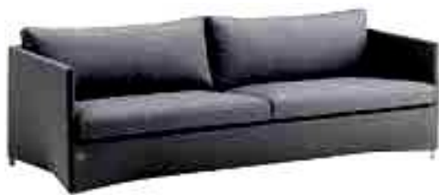
Företag: Cane-Line Modell: Diamond