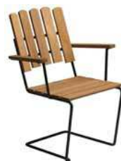
F: Grythyttan M: A2