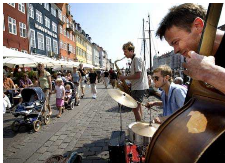
Bild från Malmö kommuns uteserveringsprogram, som visar de enhetligt utformade uteserveringarna på Nyhavn i Köpenhamn.

Fotografier av Cecilia Behm där inget annat anges. Framsida från Malmö kommuns uteserveringsprogram. Illustration på sidan 8 av Ulrika Svensson. Produktbilder på sidan 9 från respektive företag.