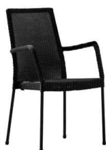
Företag: Cane-Line Modell: Newport