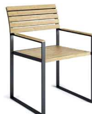
F: Röshults M: Garden bistro chair