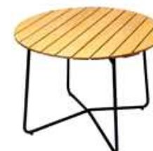
Företag: Grythyttan Modell: 9A