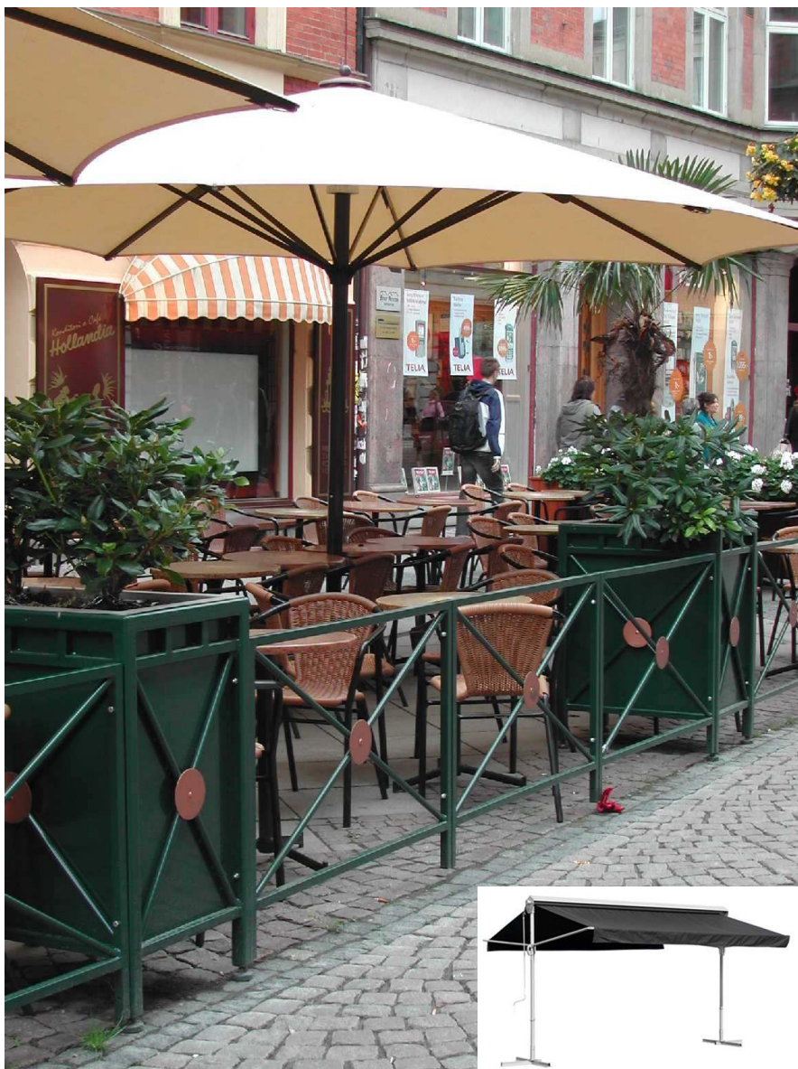
Uteserveringens tak kan ha olika utformning, men färgen bör alltid vara neutral.