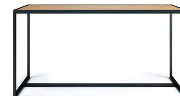
F: Röshults M: Bistro