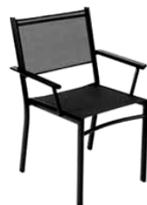
F: Fermob M: Costa