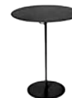
F: Nola M: Kyparn