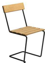
F: Grythyttan M: Stol 1