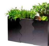
F: SMD M: Urban garden planteringslåda