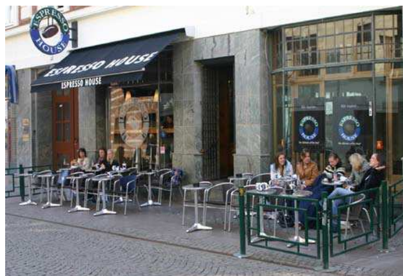
Bild från Malmö kommuns uteserveringsprogram som visar en lämplig avgränsning