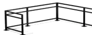
Företag: Nola Modell: Café